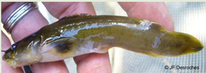
Chat-fou des rapides

Deux des espèces recensées sont considérées en situation précaire au Québec, soit le chat-fou des rapides ( Noturus flavus ) et le brochet maillé ( Esox niger ). Historiquement, le chat-fou des rapides était connu dans la rivière avant la création du réservoir et avait été observé pour la dernière fois en 1970. Sa redécouverte est une excellente nouvelle !