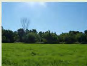
pâturages et prairies