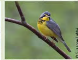
Paruline du Canada