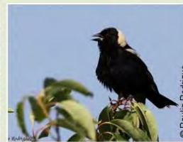
Goglu des prés