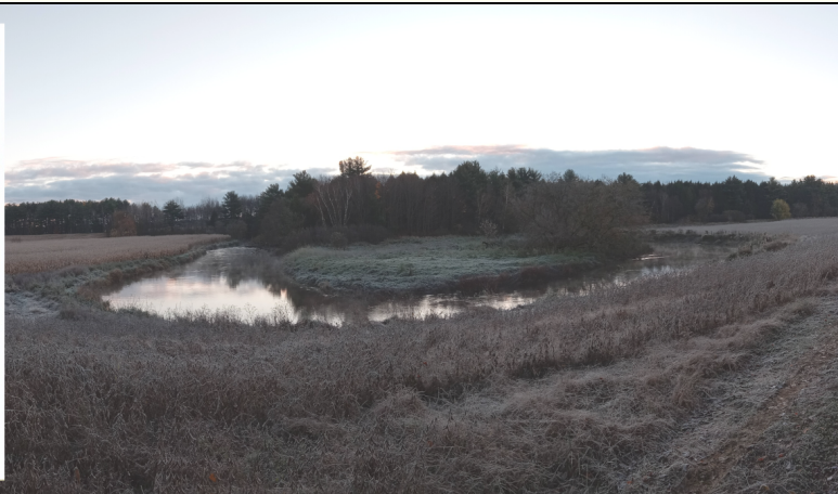
La rivière Yamaska Nord, Saint-Alphonse-de-Granby