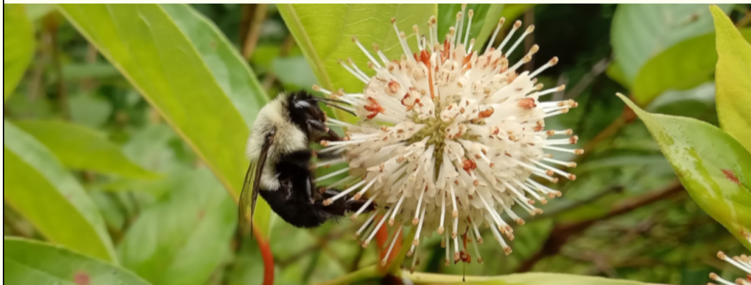
Bourdon sur bois-bouton (céphalanthe occidentale), CINLB, Granby

Suivez ce lien pour visionner leur contribution à la communauté.