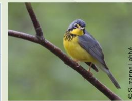
Paruline du Canada