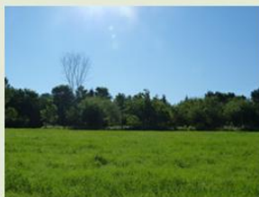
pâturages et prairies