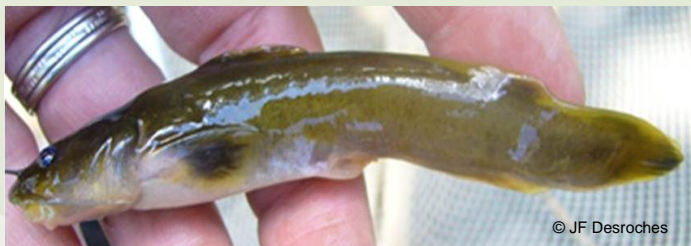
Chat-fou des rapides

Deux des espèces recensées sont considérées en situation précaire au Québec, soit le chat-fou des rapides ( Noturus flavus ) et le brochet maillé ( Esox niger ). Historiquement, le chat-fou des rapides était connu dans la rivière avant la création du réservoir et avait été observé pour la dernière fois en 1970. Sa redécouverte est une excellente nouvelle !